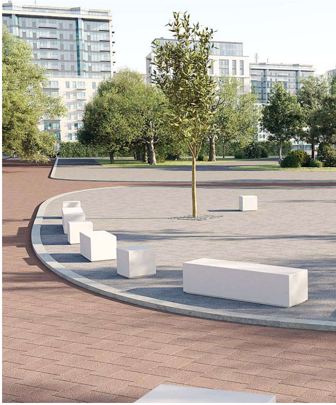
pavimentazione drenante con colorazione omogenea