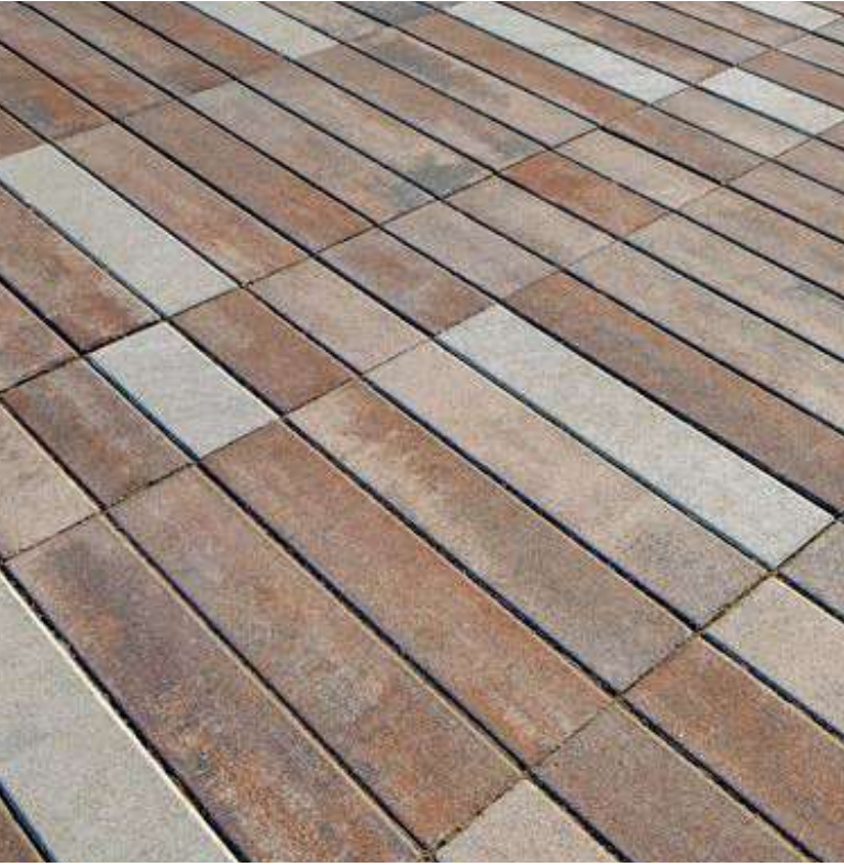
pavimentazione drenante con colorazione non omogenea