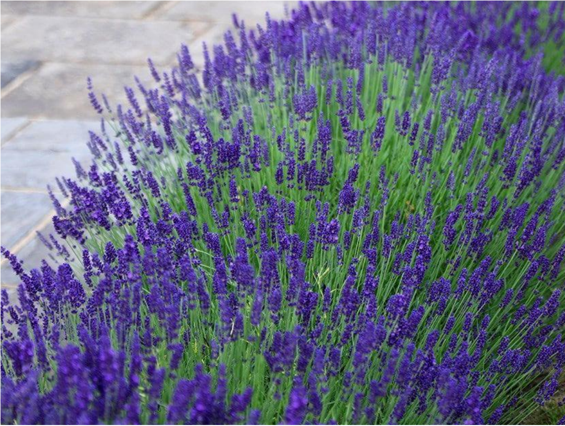
percorso con cespugli di lavanda