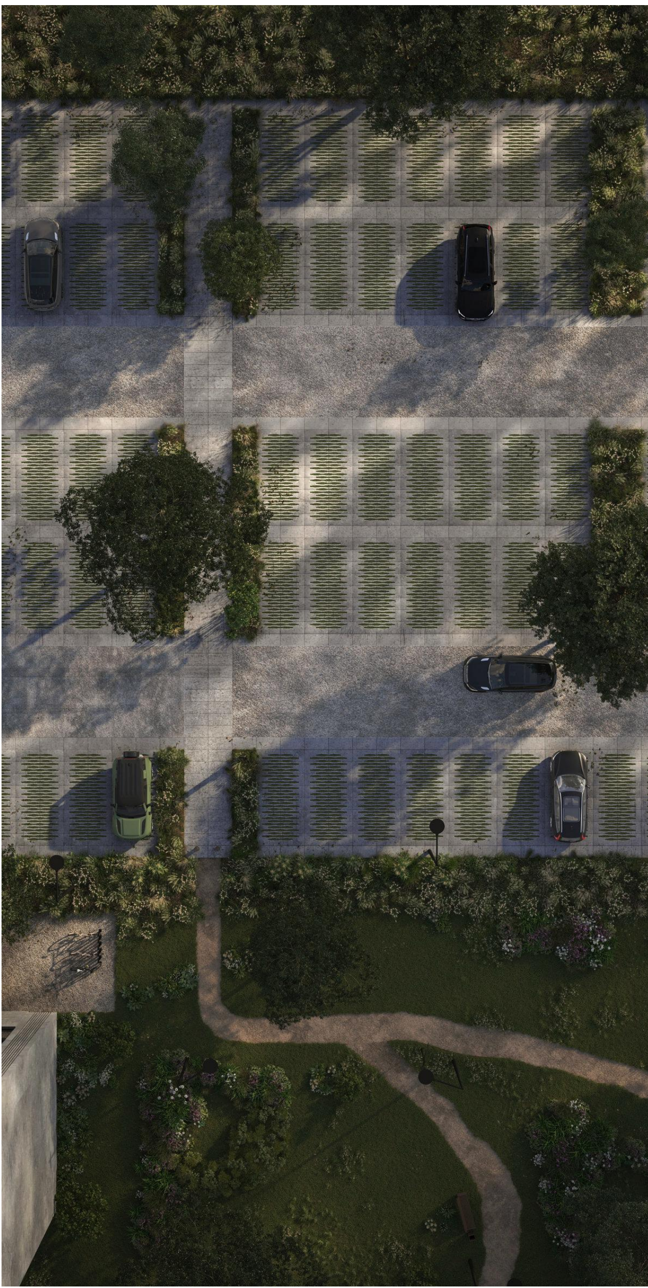
esempio di sistemazione a verde con uniformità cromatica