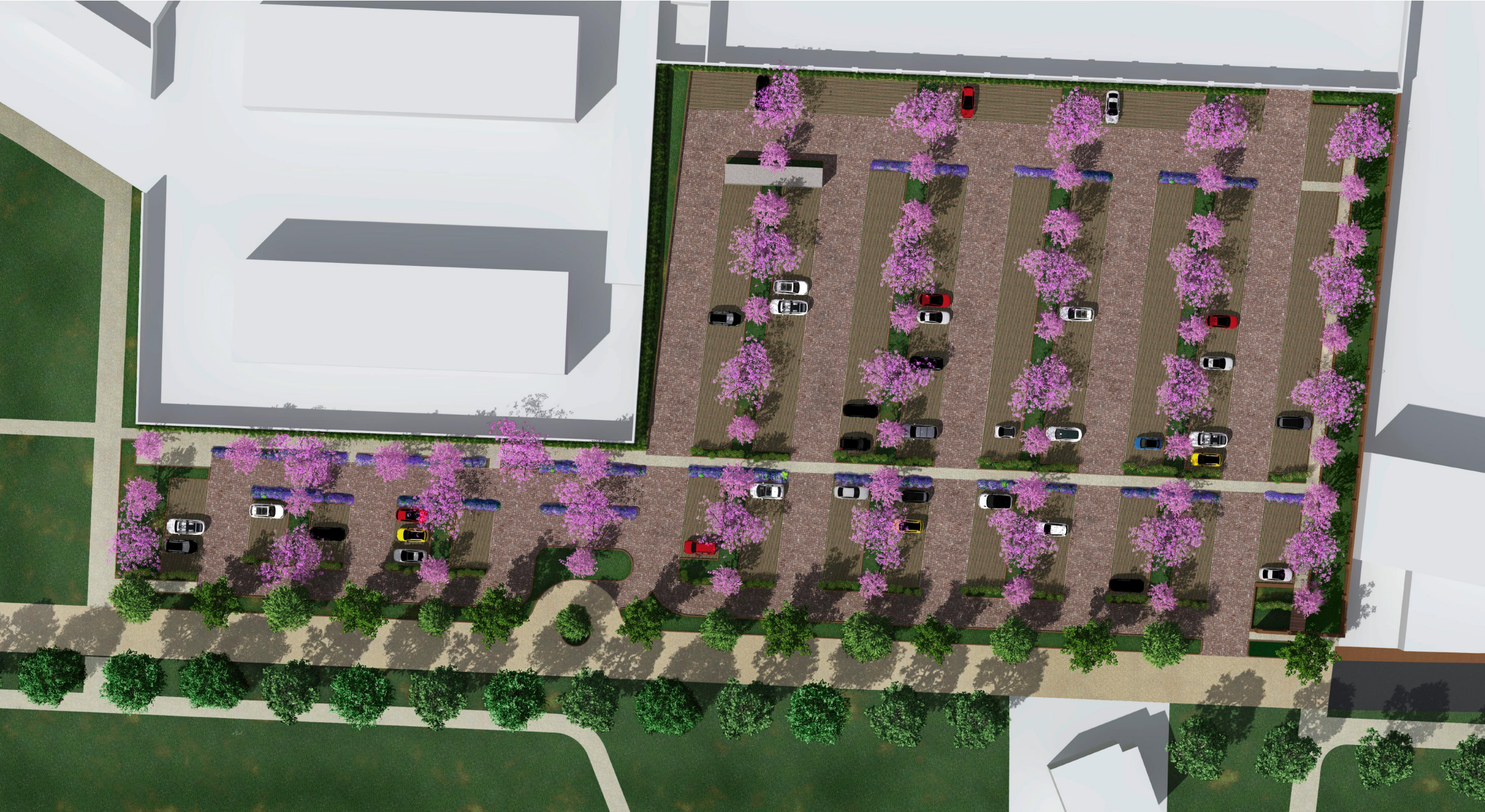
vista zenitale del progetto del parcheggio