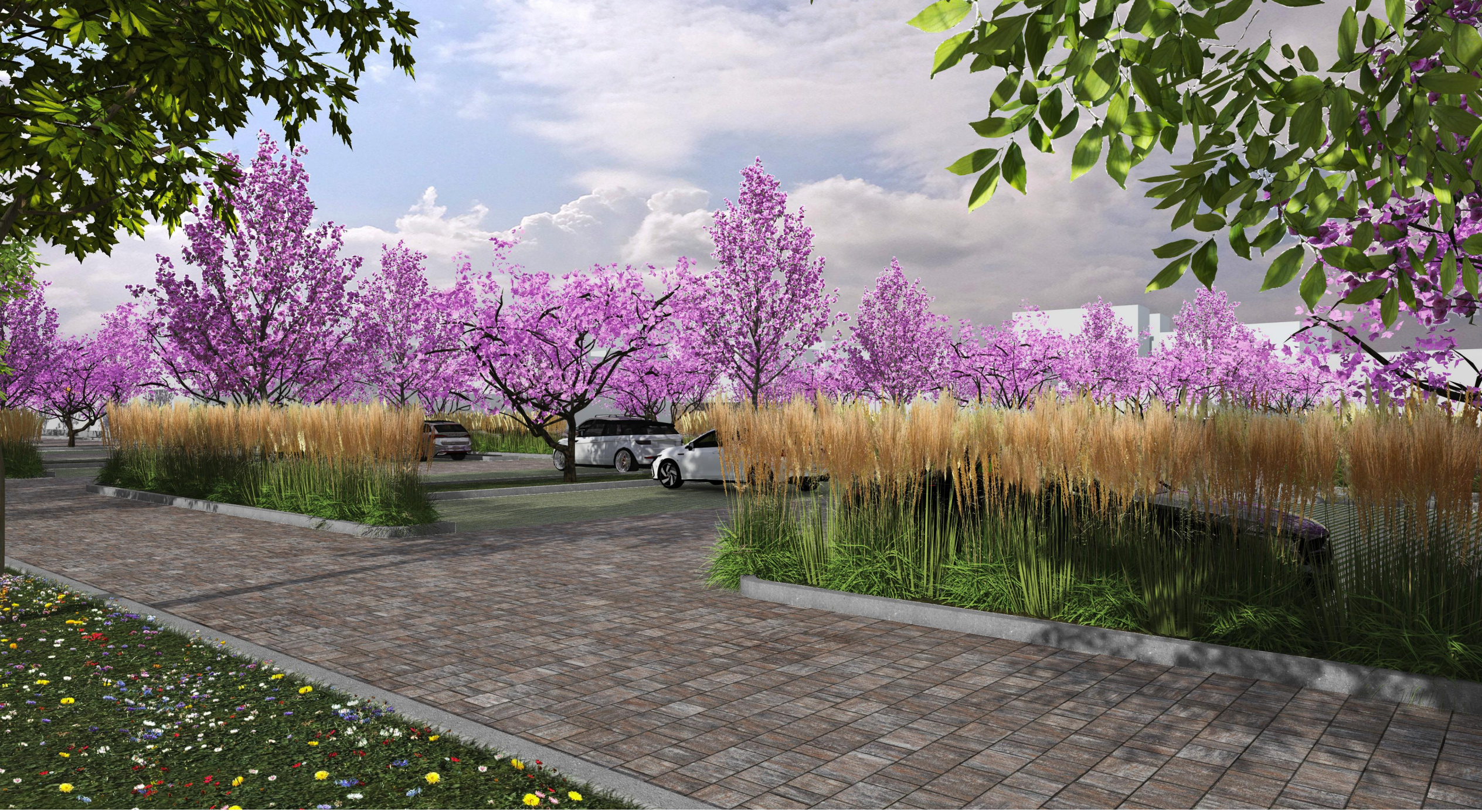
vista n°02 del progetto del parcheggio