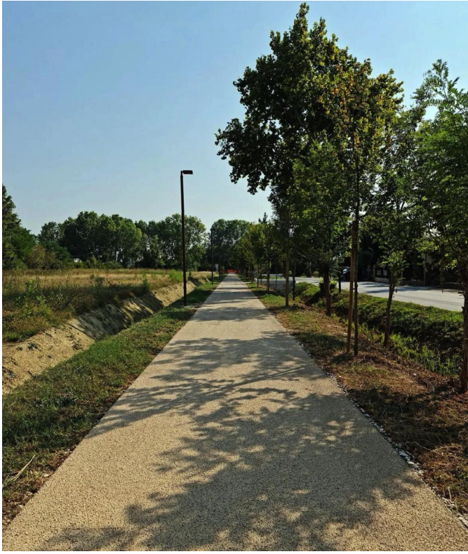
cemento drenante pigmentato