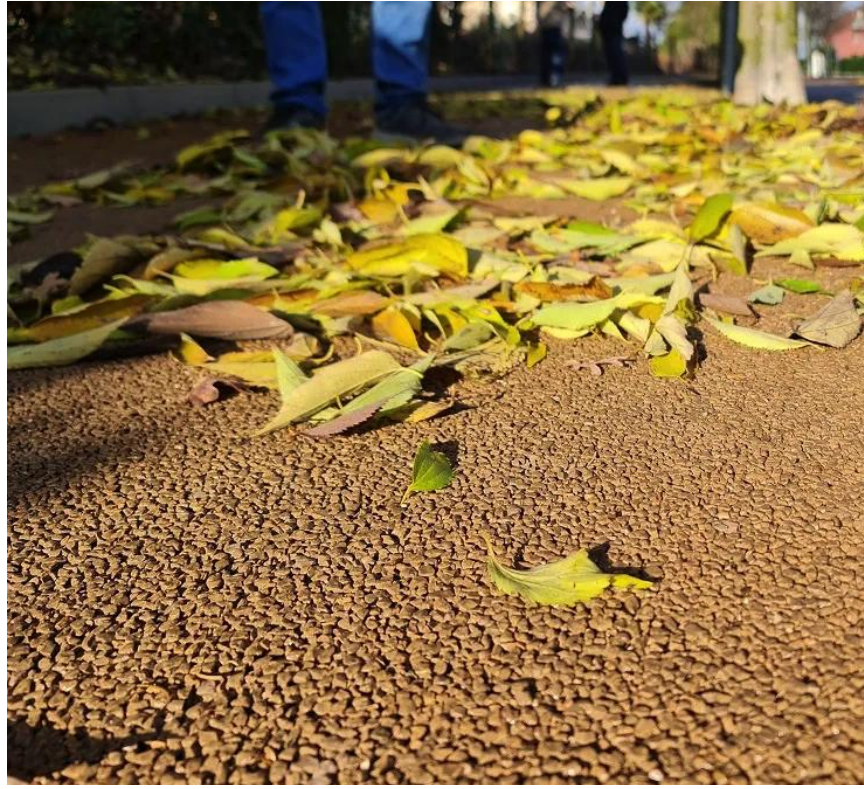
cemento drenante pigmentato