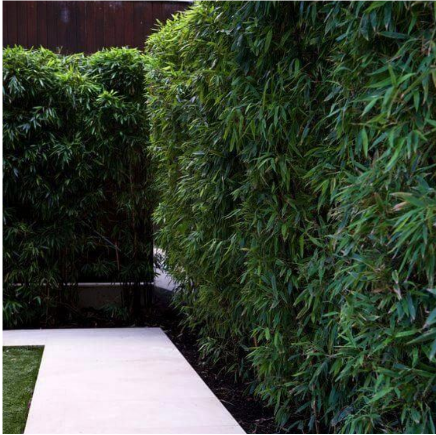
mascheratura con bamboo