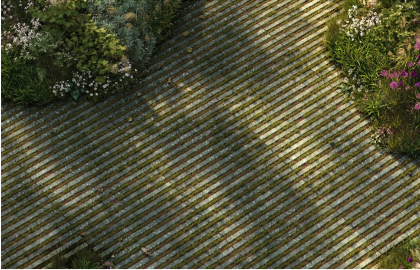
esempio di pavimentazione per stalli auto drenante