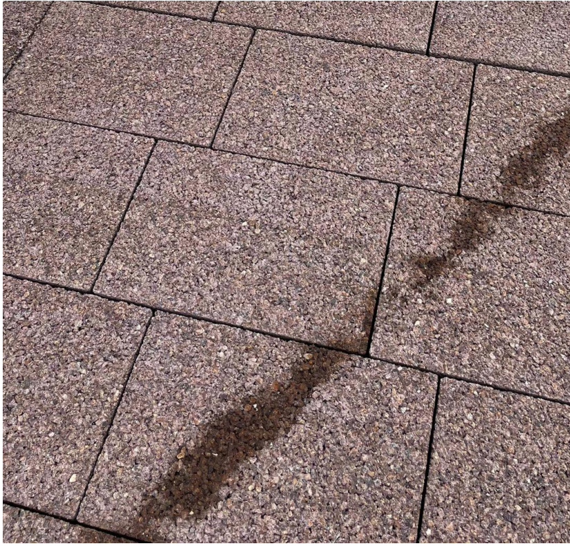
pavimentazione drenante con colorazione omogenea