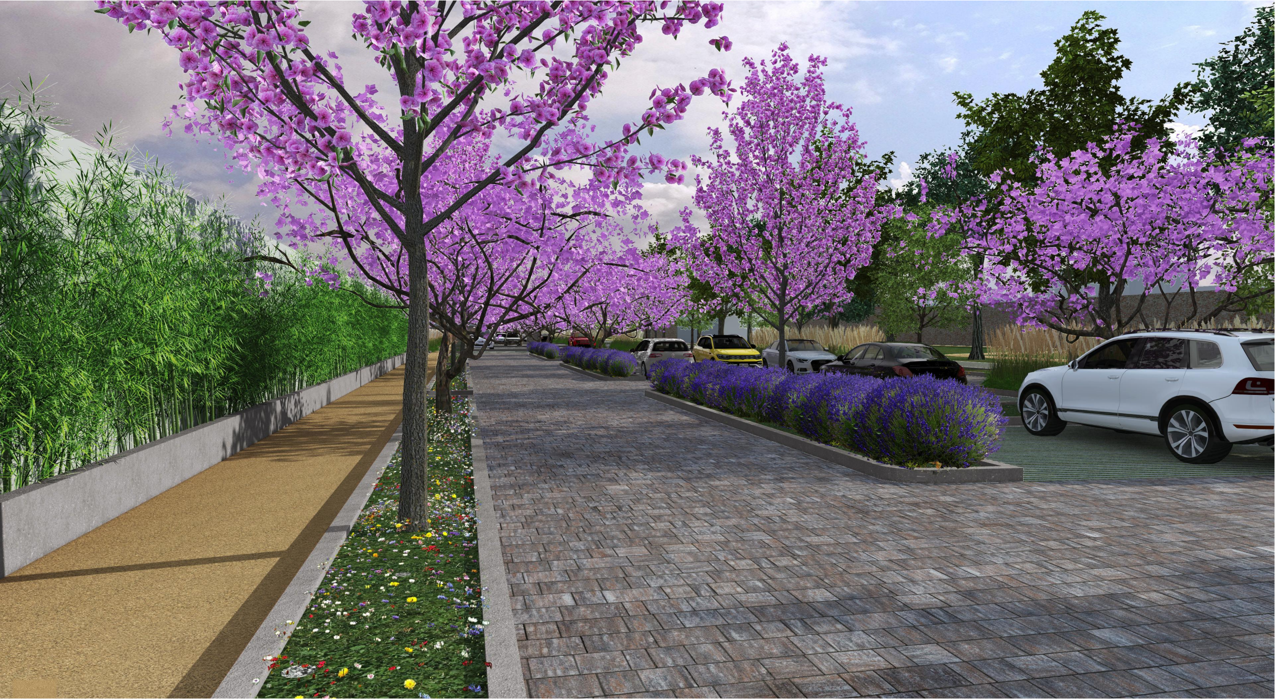
vista n°01 del progetto del parcheggio