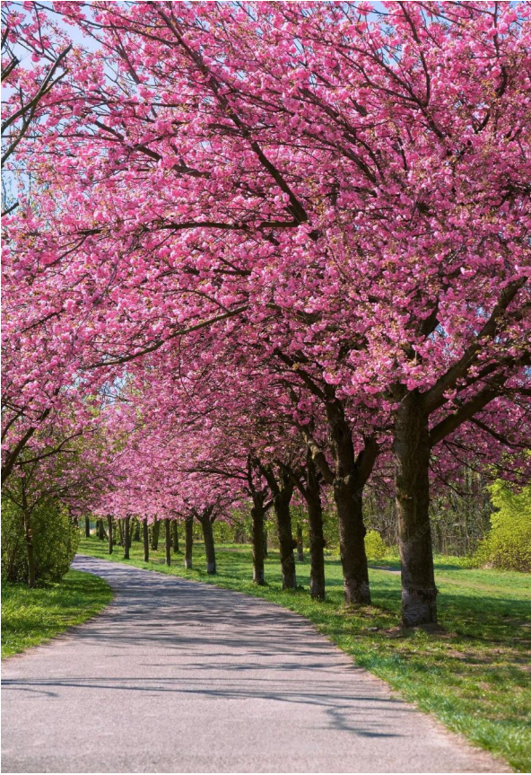
fioritura dei ciliegi