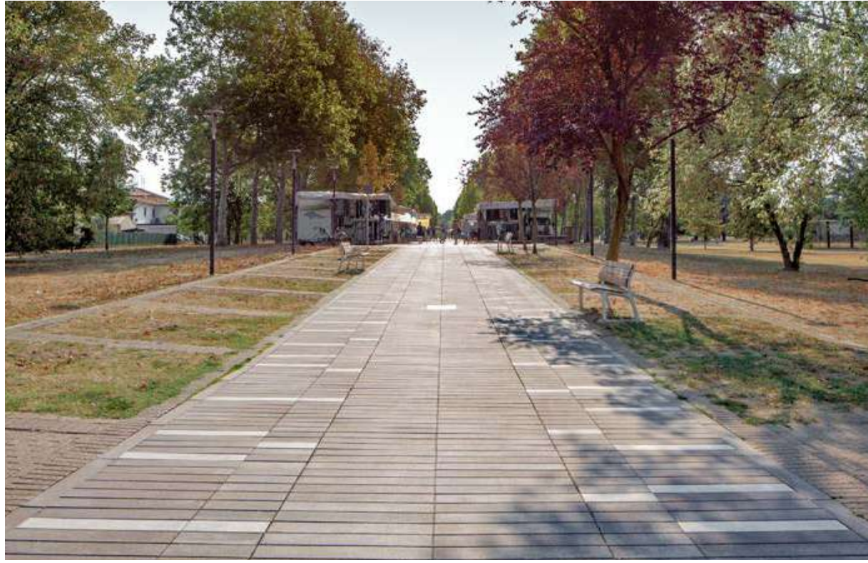
pavimentazione drenante con colorazione non omogenea