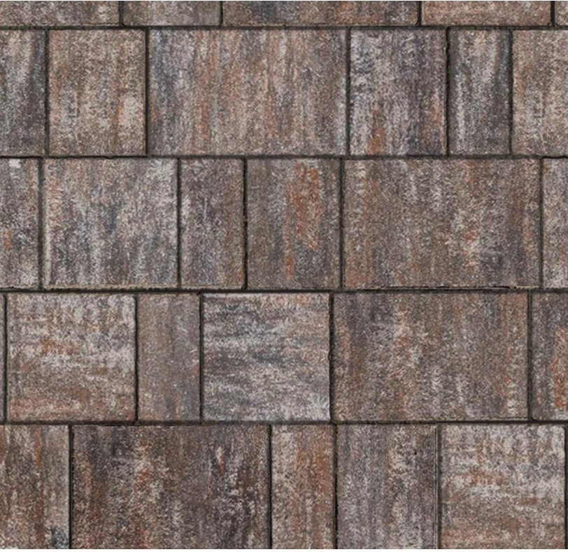
pavimentazione drenante con colorazione non omogenea