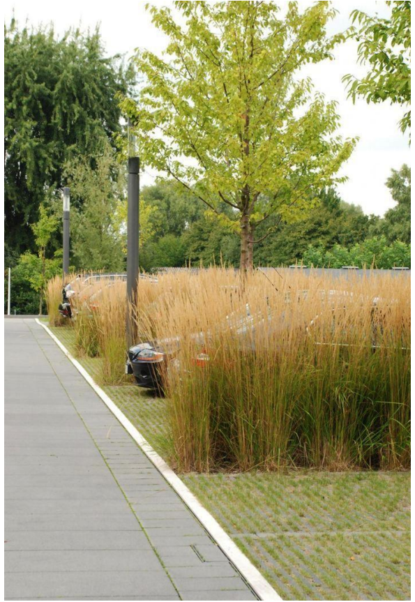
vegetazione a mascheramento auto